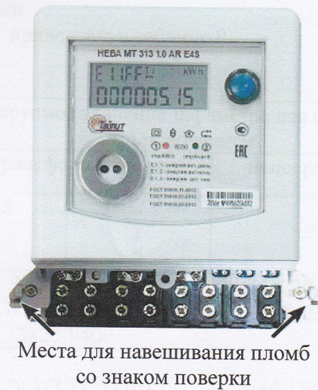
Рисунок 1 - Счетчик HEBA MT 313