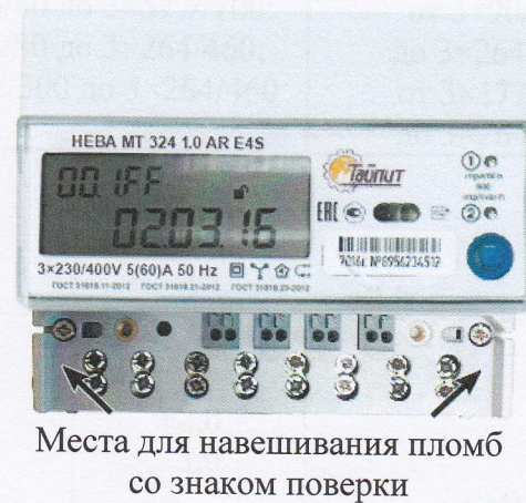
Рисунок 2 - Счетчик HEBA MT 324

Конструкция счетчиков HEBA MT 314 и HEBA MT 315 идентична счетчику HEBA MT 313. Конструкция счетчика HEBA MT 323 идентична конструкции счетчика HEBA MT 324.