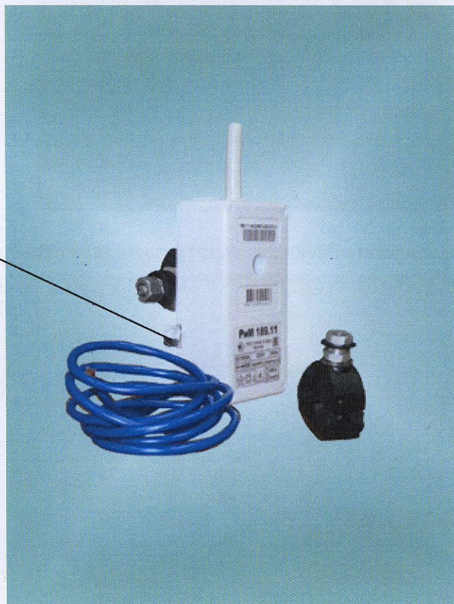
Рисунок 1 – Фотография общего вида и место установки пломбы поверителя счетчиков РиМ 189.11