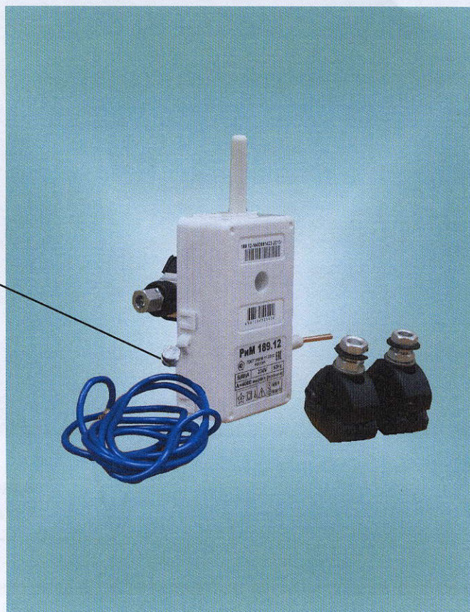
Рисунок 2 – Фотография общего вида и место установки пломбы поверителя счетчиков РиМ 189.12